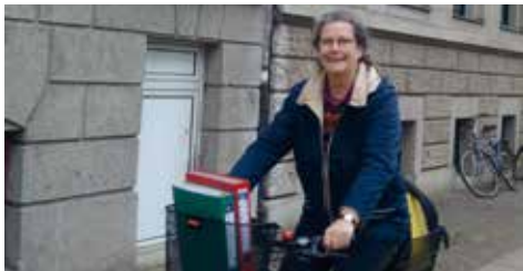
Auf dem Weg zur Arbeit